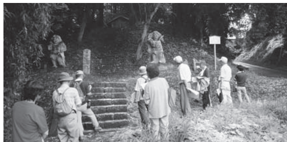
玉里郷の地域の歴史・文化財を学ぶ