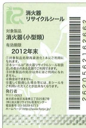
既販品用消火器 リサイクルシール 有効期限 2年

(注2) 排出場所から特定窓口または指定引取場所までの運搬については、別途費用がかかります。