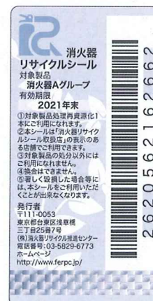
新製品用消火器 リサイクルシール 有効期限 10年