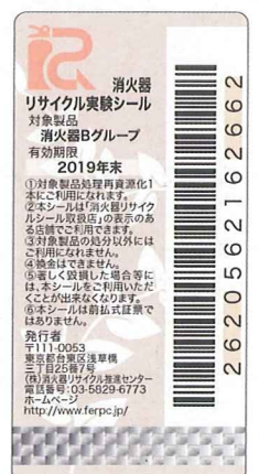
社会実験用消火器 リサイクルシール 有効期限 10年 (2010年製造分のみ)