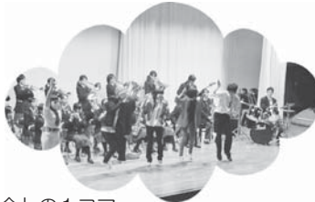
「新入生歓迎会」の1コマ→

美野里中は、学校のイベントなどかなりの盛り上がりを見せています。3月に行われた「3年生を送る会」では、お世話になった3年生への感謝の気持ちを伝えるために、各クラスで企画を練って、オーディションに合格した団体がダンスや劇の発表をしました。第2回にして、非常に高いレベルの発表で3年生がとびきりの笑顔を見せてくれたことが印象に残っています。今年度は、新入生にも美野里中としての意識をもってもらえるように、委員会活動や部活動の紹介を行いました。これからも、生徒総会や美風祭（文化祭）など、生徒会一同、美野里中学校を引っ張るための原動力になっていきます。