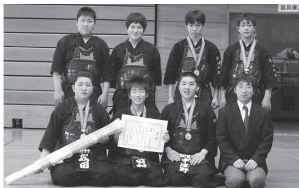
中学校男子の部で優勝した美野里中学校剣道部の皆さん