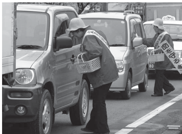
ドライバーにチラシ、啓発物を手渡し、交通安全を呼びかけました

4月6日から15日の期間で「春の全国交通安全運動」が実施されるのに伴い、小美玉市でも市内の関係団体をはじめ、石岡警察署、石岡地区交通安全協会が参加し、各所で街頭活動が実施され、信号待ちのドライバーにチラシや啓発品等を配布して交通安全を呼びかけました。