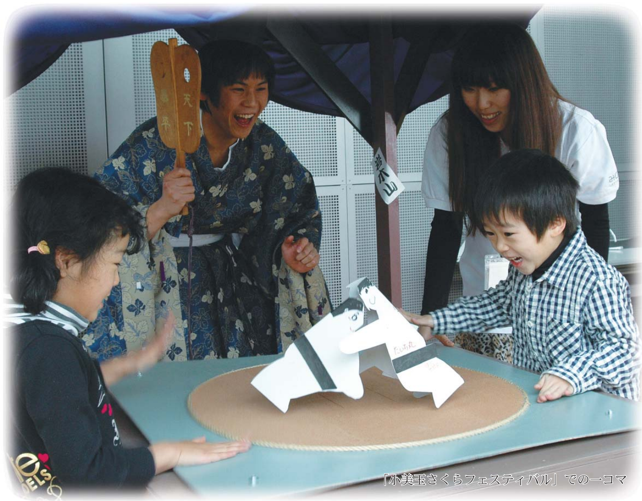
「小美玉さくらフェスティバル」での一コマ