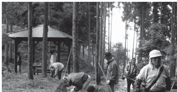
歴史と自然とのふれあいの場。羽黒古墳での奉仕作業