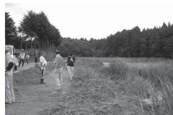
大正地池の刈り払い作業

羽黒古墳公園・大正地池の畔の保全と花づくりを進め、動植物の観察や散策、憩いの場としてさらに利用されることを願って設立しました。草刈り、植栽、園路の整備、古墳公園周辺の花づくり（春に菜の花、秋に蕎麦の花）などを区会議員を中心に全住民で活動しています。