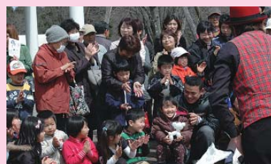
◀「じっさい」のショー

【お詫びと訂正】 広報おみたま4月号中に誤りがありました。 表紙 目次中 (誤) 「平成22年度 市制方針と市の予算」 (正) 「平成22年度 市政方針と市の予算」 11ページ中 (誤) 「■紅綬褒章」 (正) 「■藍綬褒章」 深くお詫びして訂正させていただきます。