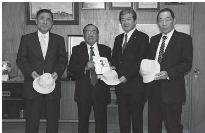
各農協の代表理事組合長の皆さん