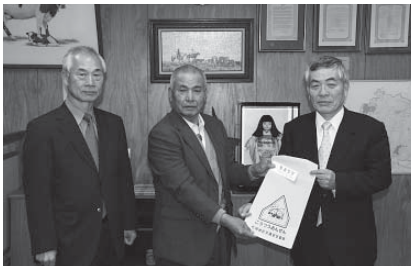
石岡地区交通安全協会の皆さん