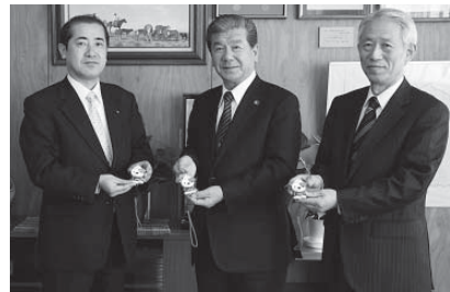
常陽銀行美野里支店長（写真左）