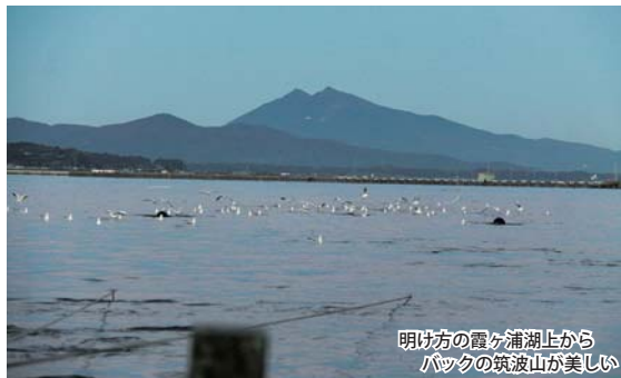
明け方の霞ヶ浦湖上からバックの筑波山が美しい

昔は300人以上の漁師がいました。その頃は霞ヶ浦も透明で、底が見えるほどきれいだったんだよ。今はざざ海老もわかぎも、その頃より小ぶりになって