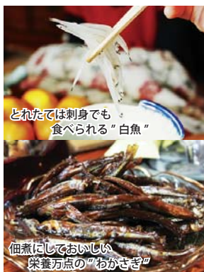
とれたては刺身でも食べられる“白魚”