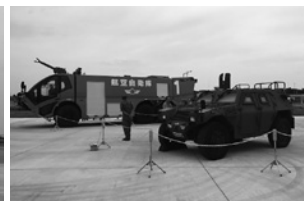
主催: 百里飛行場(茨城空港)利用者利便向上協議会 ほか