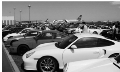
▲スーパーポルシェ

主催: 小美玉市茨城空港利用促進協議会、(一社)小美玉観光協会 問い合わせ: 小美玉市空港対策課 0299-48-1111 (内線 1171)