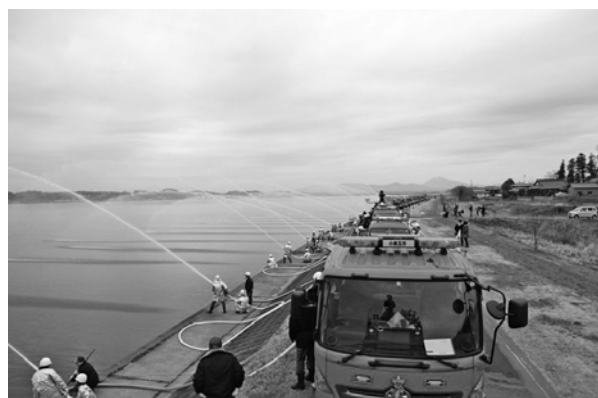
(写真 平成31年1月12日撮影)

*当日の朝7時に防災無線で招集サイレンが市内で鳴ります。火災と間違えないようお気をつけください。