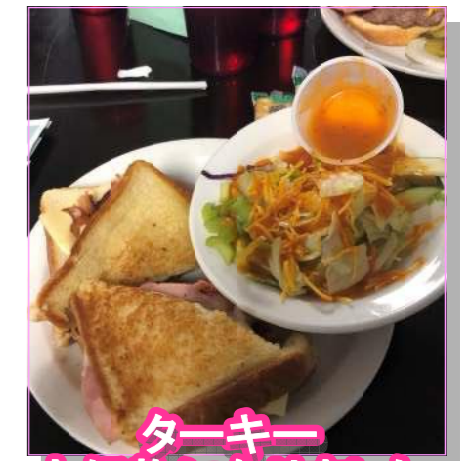
ターキー 大好物になりました