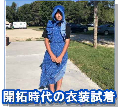
開拓時代の衣装試着