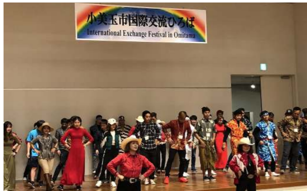
▲カントリーダンスをたくさん練習しました！