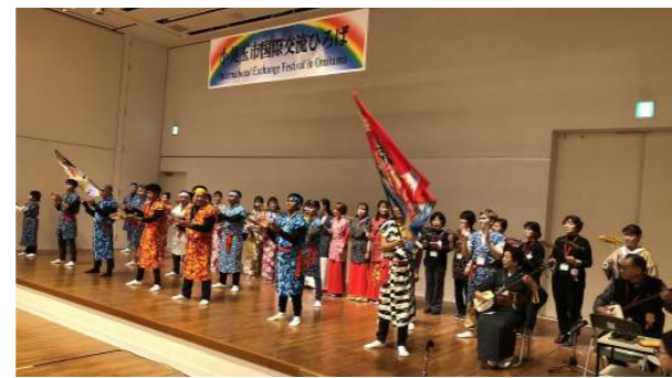
▲三味線と歌に合わせてソーラン！ソーラン！