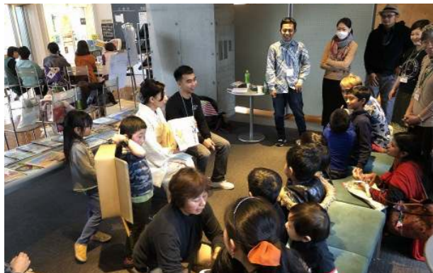
▲絵本をベトナム語・英語で読み聞かせをしました！