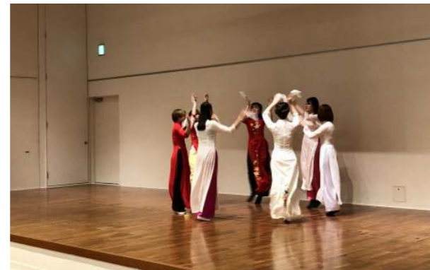
▲美しいベトナム舞踊を披露しました！