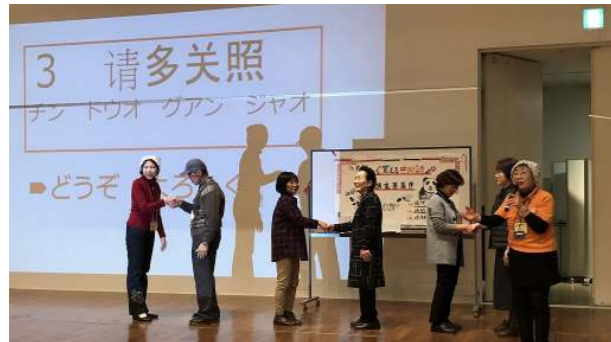
▲中国語で脳の活性化！スパイスアップ！