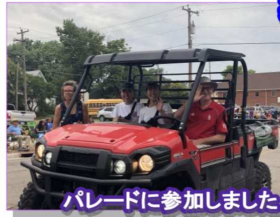
パレードに参加しました!