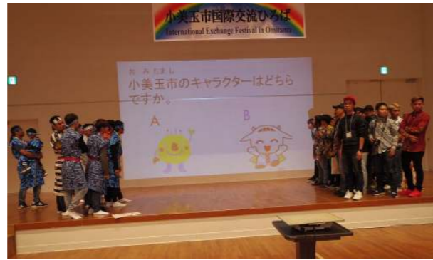
▲たくさんの方がクイズに参加しました！