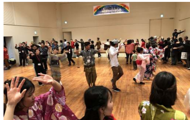
▲毎年恒例！大きな大きな輪になろう！