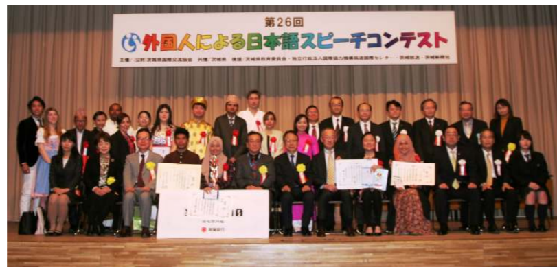
受賞者達と記念撮影

このコンテストは、茨城県内で生活している外国人の皆さんが日頃考えていることや、日本・茨城の印象や母国の話しなど、茨城県民との相互理解を深めるテーマを日本語で発表し、異文化交流を促進するものです。予選を通過した15名の方達が、審査委員7名による選考により県知事賞をはじめとした受賞者が決定されます。