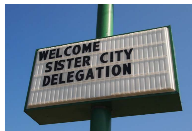
「訪問団歓迎」の文字に一同びっくり！