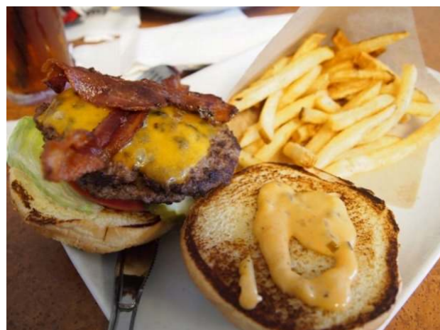
アメリカンサイズ