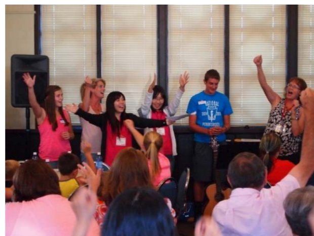
みんなで歌って盛り上がりました！