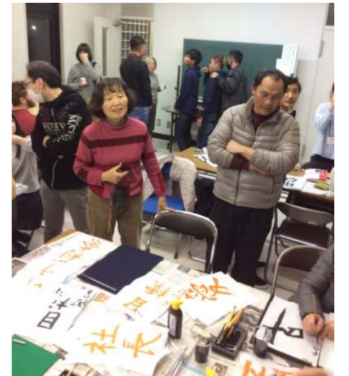
新年最初のクラスは、みんなで新年の抱負などを書き初めするのが恒例になっています！