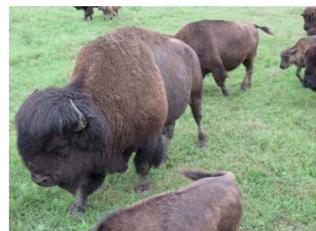
アメリカバイソンに餌やり体験しました