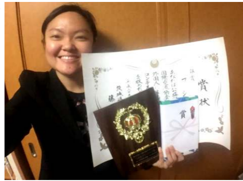
受賞に満面の笑顔！

「第26回外国人による日本語スピーチコンテスト」で「シンガポール人と日本人の水に対する意識」というスピーチを発表しました。先生達は優しく原稿や、スピーチの発音を直したり、当日には会場に応援してくれて、とても心強かったです。いつも「日本語教室サバイディ」で先生や友達と日本語を勉強しながら、楽しくフリートーキングして日本語もだんだん上手になりました。このコンテストに挑戦できたことが何よりすばらしい経験となりました。応援ありがとうございました！