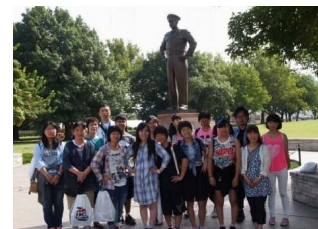
アイゼンハワー大統領と一緒に