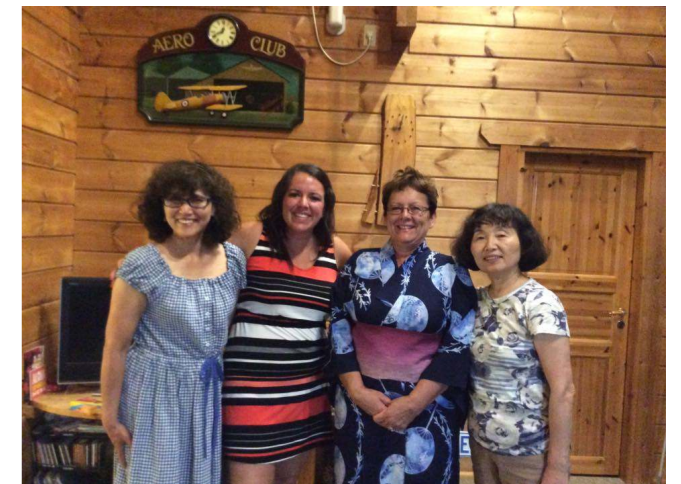
素敵な笑顔が生まれる姉妹都市の人達との交流。

「ダイヤモンドシティプロジェクト」の動画にも岡村さんが出演されていますので、ぜひご覧ください。「いいね 小美玉 輝き続ける You Tube」で検索！