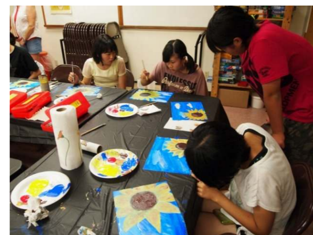
みんな画伯!? 新たな能力発見!?