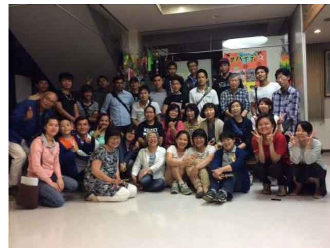
授業が終わってからみんなで記念撮影