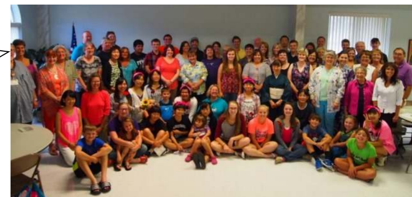
お別れパーティーでみんなで記念撮影 別れがつかない

ぜひ皆さん、アビリン市にお越し下さい！ お待ちしております！ We will welcome you every time you come! See you in Abilene!