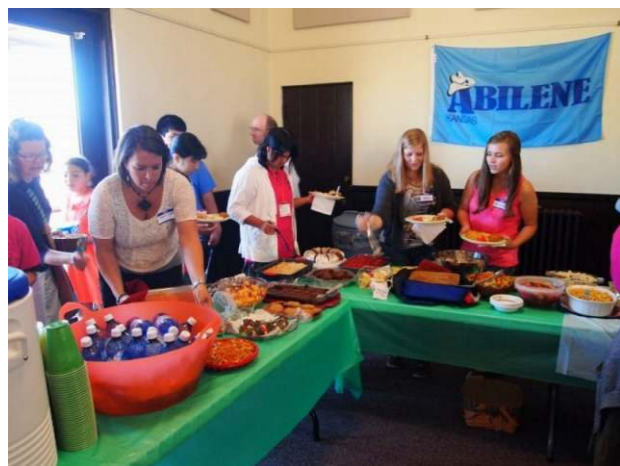
ウェルカムパーティーで大歓迎！

平成29年度の募集概要は次項の通りで募集期間は平成29年4月3日（月）～4月21日（金）となっています。皆様のご近所の方にもお声かけいただき、アビリンとの心の交流を共有しましょう！