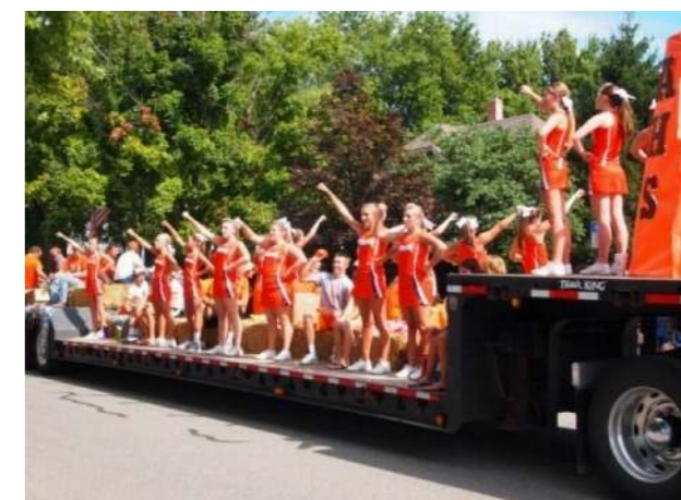
市をあげてのお祭りでのパレード