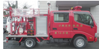
第14分団 可搬ポンプ積載車