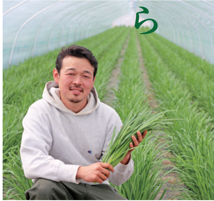
JA 新ひたち野 小川にら部会 青年部