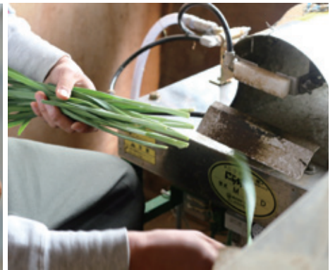
余分な葉や土を落とし、計量・袋詰めする「調製」は、機械と手作業で。品質を保つには人の目での確認や手作業が欠かせません。