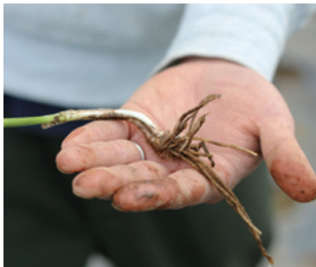
ニラの苗。ニラはユリ科の植物で、球根があります。6月頃に苗を植えつけします。