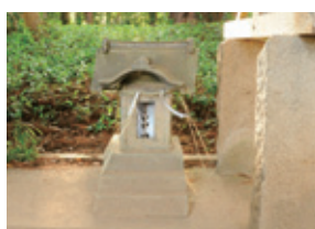
鹿嶋神社（下馬場）にある疱瘡神社

江戸時代の民衆にとって疱瘡（天然痘）は、疫病神が引き起こすと考えられており、疱瘡神としてお祀りすることで、感染者の平癒を祈りました。