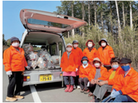
平成19年から毎年実施している清掃活動。今年は9名が汗を流しました。

水質浄化、食品ロスや振り込め詐欺などの幅広い分野に関心を持って勉強・実践するボランティア団体として、昭和49年に結成されました。しかし、会員数が年々減少しており、このままでは活動が難しくなってしまいます。ご興味のある方、ぜひ一緒に活動しませんか？