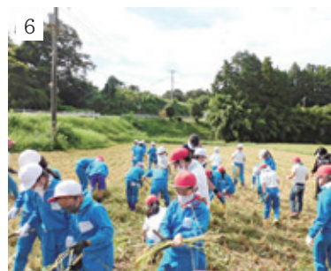
1_一斉下校風景 2_プログラミングの授業 3_運動会 4_ツルレイシの観察 5_避難訓練(地震) 6_稲刈り

校 舎に寄り添うようにそびえ立つタイサンボクが、いつも児童を見守っています。創立134年となった昨年度は、コロナ禍の影響を大きく受けました。しかし、全員で対策を遂行し、例年5月に行われていた運動会も10月に延期して開催することができました。田植えを行うことはできませんでしたが、地域の方やPTAの方々のおかげで、稲刈りを行うことができました。