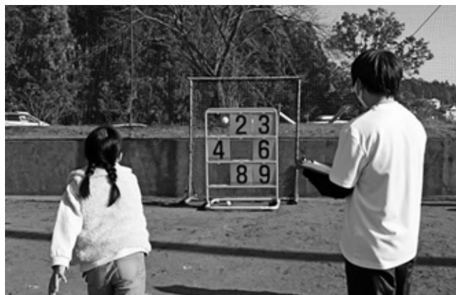
ストラックアウト

備品は、一般財団法人自治総合センターが宝くじの社会貢献広報事業として実施している助成を受け、整備しています。