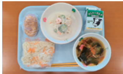
幼稚園・小学校献立