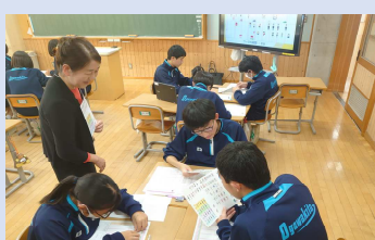
●結婚子育て応援事業（中学生ライフデザインセミナー開催） 1,022千円