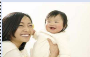
●出産子育てアプリ事業（出産子育てに役立つ情報を発信） 204千円