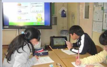
●小・中学校等情報教育事業（パソコン使用料） 19,799千円