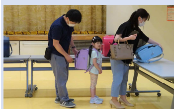
●新入学児童用ランドセル購入事業（ランドセルの贈呈） 7,800千円