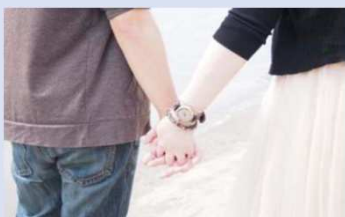
●不妊治療補助金事業（不妊治療に対する補助金） 3,722千円