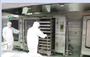
●共同調理場施設維持管理経費（蒸気発生器蓄熱槽更新工事等） 22,794千円