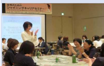
●女性活躍推進事業（女性起業創業セミナー・女性人材セミナー開催） 379千円

未来を担う子どもたちの個性を生かし、豊かな創造性を育むとともに、地域の特色を活かした教育を推進するため、また、安心して子どもを産み、育てることができる地域社会の構築を目指すための施策に活用させていただきました。