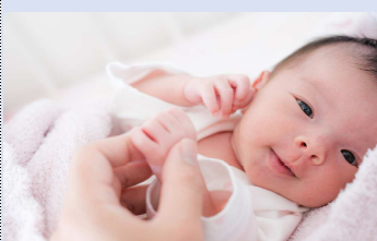
●出産祝金事業（出産祝金を支給） 130千円