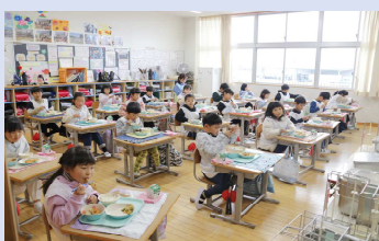
●共同調理場運営経費（給食用備品購入） 4,000千円