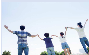
●子育て世帯臨時応援給付金事業（子育て世帯へ給付金を支給） 10,000千円