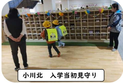
小川北 入学当初見守り

保護者や地域の方が学習支援に関わっていただけることで、子どもたちの「わかる」・「できる」が増えています。また、そばで見守っていただけたことで、子どもたちは安全・安心に活動することができました。お忙しい中、ご協力いただき、誠にありがとうございます。