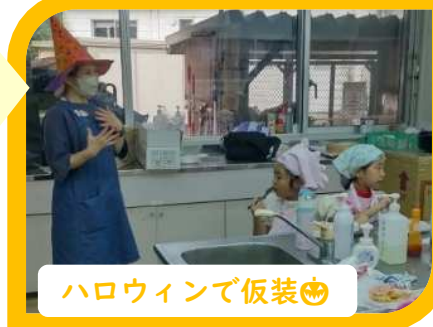
ハロウィンで仮装🍷