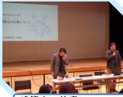
建築士の仕事について