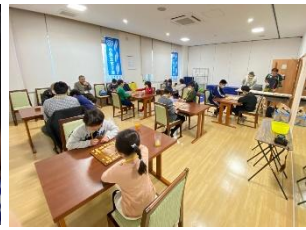
たくさんの参加者