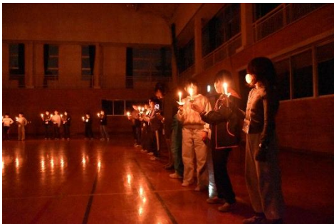
幻想な雰囲気のカンドルサービス