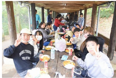
みんなで作ったカレーライス