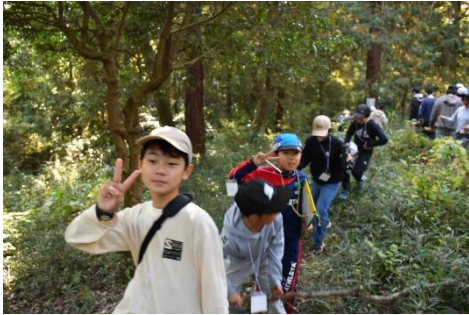
屋外オリエンテーリング

子どもの自然体験活動の充実とジュニアリーダーの育成を目的に、11月8日から泊2日の日程で、茨城県立中央青年の家(土浦市)において開催しました。小学4～6年生に加えて、サポート役の中・高校生(リーダーズクラブ小美玉)、子ども会役員、他市で活動する高校生会、合わせて62名が参加し、野外オリエンテーリング、レクリエーション、キャンドルサービスなど思い出に残る研修会になりました。初めて会った子どもたちも、コミュニケーションを取りながら、楽しい二日間を過ごしました。子どもたちは、学校では体験できない体験を通して、新たな友達を作ることができました。