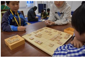
初心者向けのブースも!

結果は、接戦の末、ご長老の勝ち。将棋という娯楽を通して、年齢を越えた熱い対局に、終局後には、温かな拍手が送られました。