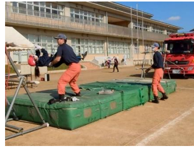
「ロープブリッジ体験」