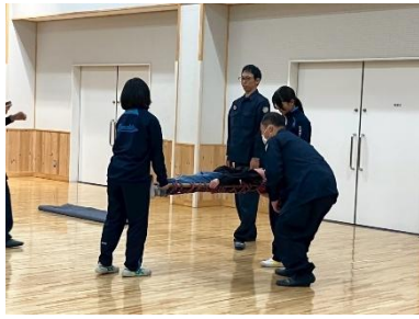
「警察による応急搬送講習」