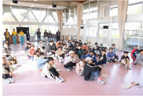
緊張した様子の入所式