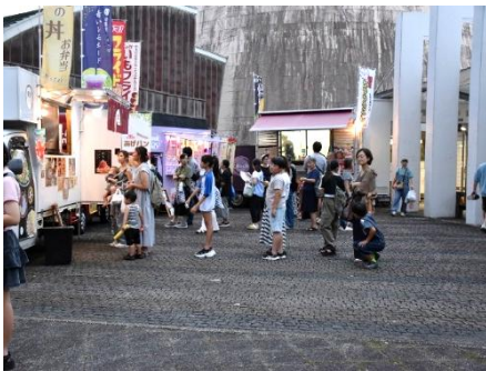
おいしいキッチンカー