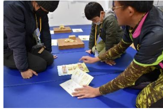
噂のどうぶつ将棋も初投入!