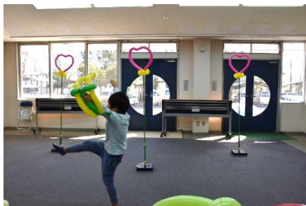
いろんな企画に、子どもも大人も楽しみました