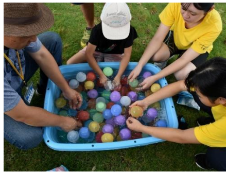
水鉄砲バトルの準備