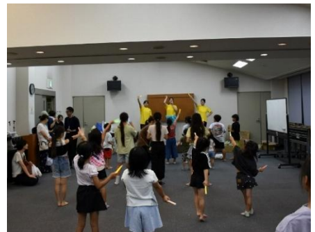
室内でダンスもやりました！